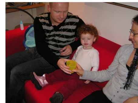
Mælkeprovokation hvor barnet får mælk hver \frac{1}{2} time.