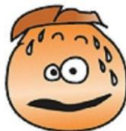
MEST LYST TIL AT SIDDE ELLER LIGGE STILLE