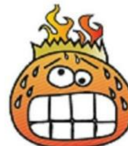
LYST TIL AT GRÆDE