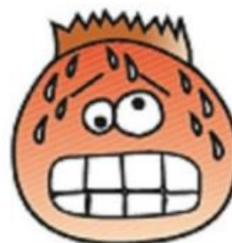
TÆNKER HELE TIDEN PÅ, AT DET GØR ONDT