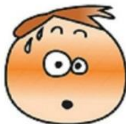
STANDSER INDIMELLEM OP