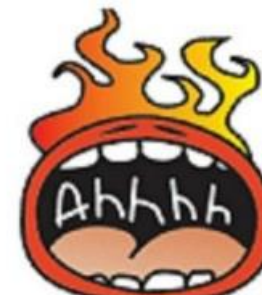
GRÆDER OG KAN INGENTING

Hvor gjorde det ondt? –Indsæt tal ud fra billedet nedenfor i skemaet på den anden side. Man må gerne skrive flere.